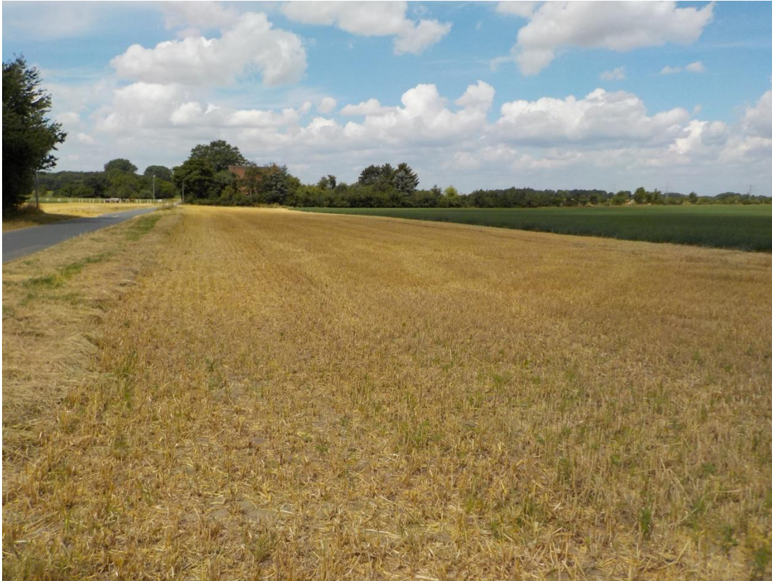
Abb. 3: Geerntetes Gerstefeld und angrenzender Saum im Bereich des Bebauungsplan-Gebietes „Am Forsthaus“ im Juli 2016 (Blick nach Westen)