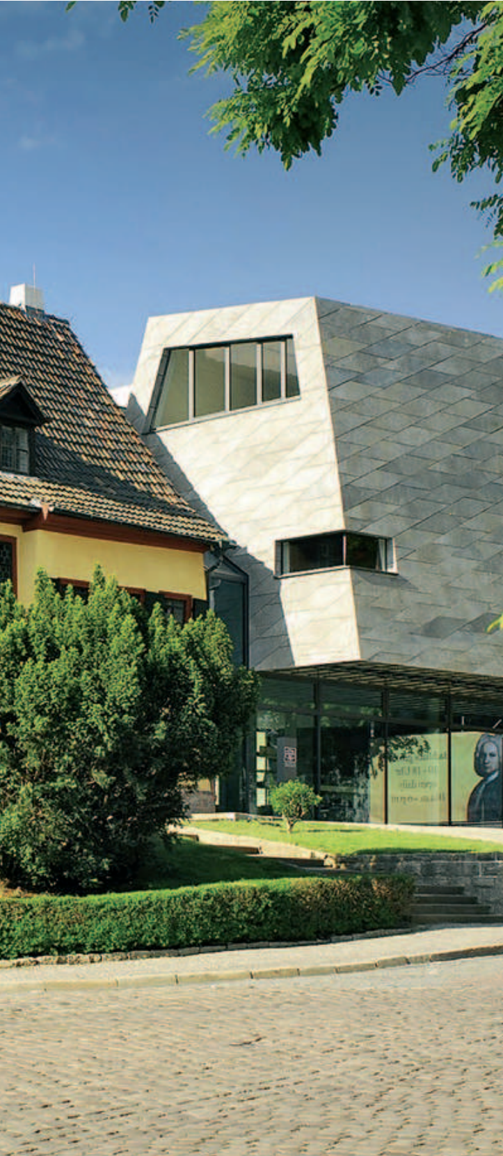
Bachhaus mit Erweiterungsbau in Eisenach