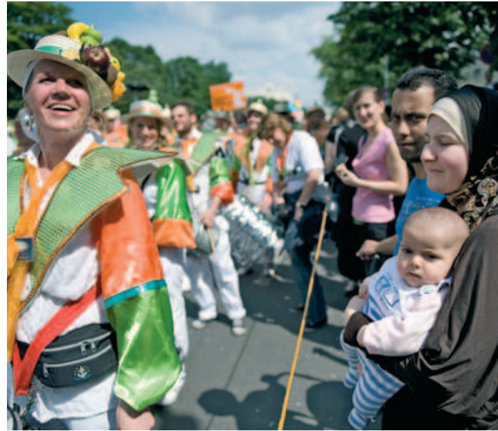
Karneval der Kulturen, Berlin

Dagegen haben Innenstadtquartiere mit hohen Anteilen gut integrierter Zuwanderer häufig den Vorzug einer besonderen Lebendigkeit, der sich wiederum positiv auf die lokale Ökonomie im Quartier auswirkt. Diese Gruppen bilden eine wichtige Säule im Produktions- und Dienstleistungssektor, bilden wirtschaftliche Brücken zu ihren Herkunftsländern und fördern damit den Im- und Export.