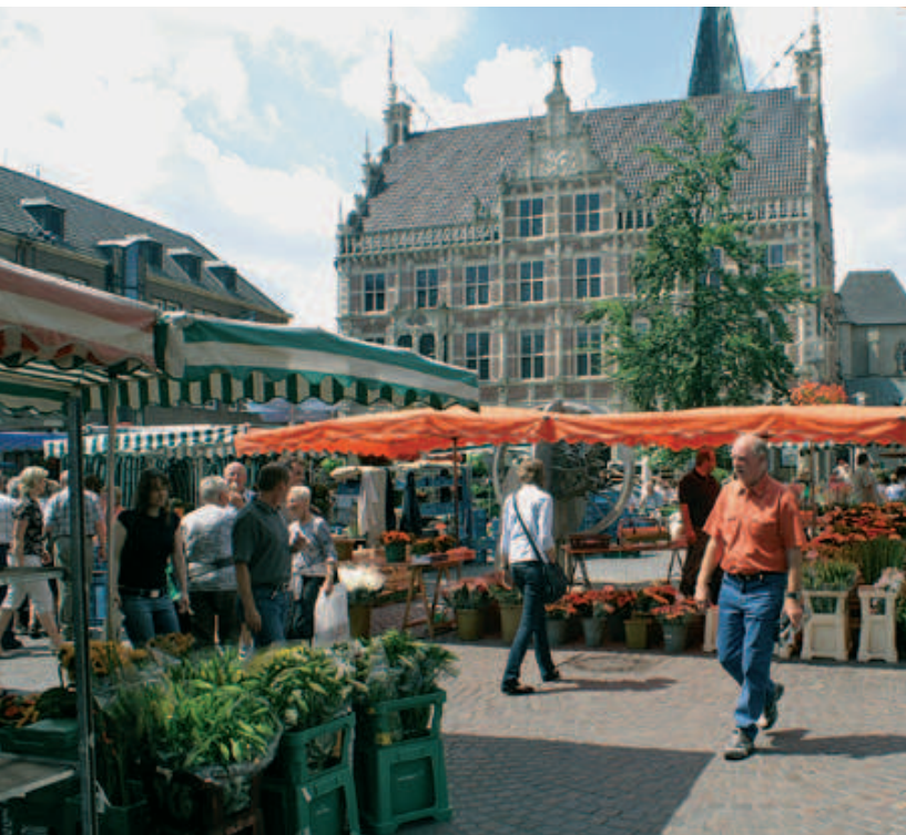
Wochenmarkt vor dem historischen Rathaus der Stadt Bocholt

Regionale und lokale Netzwerke: Stadtentwicklung wird wesentlich durch Eigentümerinnen und Eigentümer von Grundstücken und Immobilien sowie von Gewerbetreibenden mitbestimmt. In einer verbesserten Koordination und Kooperation der privaten Interessen liegen noch erhebliche Potenziale. Regionale und lokale Kooperationen, wie z. B. Eigentümerstandortgemeinschaften, sollten inhaltlich und in Bezug auf rechtliche Regelungen weiterentwickelt und in geeigneten Fällen aus der Städtebauförderung unterstützt werden.