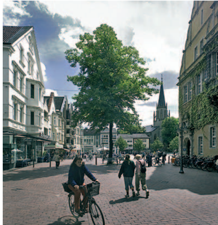
Königstraße in Gütersloh mit Blick auf die Martin Luther Kirche

Vor dem Hintergrund steigender Kosten für Energie und Mobilität wird die Attraktivität von Innenstädten langfristig steigen. Allerdings wirken sich die zu erwartenden klimatischen Veränderungen gerade in den Innenstädten mit ihrer baulichen Dichte aus (z. B. lokale Hitzeinseln, Hochwasserereignisse). Hier besteht sowohl großes Potenzial als auch eine Zukunftsaufgabe, die Innenstadt durch bauliche Anpassungen und eine integrierte Freiraum- und Grünplanung attraktiv und zukunftsfähig weiterzuentwickeln. Innovative Verkehrstechnologien wie die Elektromobilität und die Weiterentwicklung des ÖPNV bieten große Chancen, innerstädtische Mobilität leise, sauber und klimafreundlich zu gestalten.