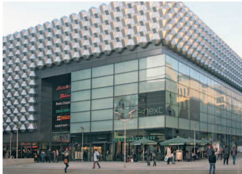
Centrum Galerie in Dresden

Eine aktuelle Herausforderung für die Stadtentwicklung ist die wachsende Anzahl innerstädtischer Einkaufszentren. Insgesamt sind heute über 400 Einkaufszentren in Betrieb, davon ein Drittel innerstädtisch, weitere 80 – meist innerstädtisch – befinden sich in Planung. Für jedes dritte bestehende innerstädtische Einkaufszentrum besteht Revitalisierungsbedarf. Grundsätzlich kann eine Neueröffnung zur Stärkung der Zentren beitragen. Gleichwohl müssen mögliche negative Auswirkungen auf Erscheinungsbild, Einzelhandelstruktur, Mieten und Umsätze in angrenzenden Geschäftsstraßen und Fußgängerzonen sehr genau bedacht werden. Vor allem Standorte an Innenstadtrandlagen bedürfen einer besonderen Abwägung hinsichtlich städtebaulicher Effekte. Weil es sich meist um große nach außen geschlossene Baukörper handelt, ist ihre baukulturelle und stadtstrukturelle Verträglichkeit und ihre Einbindung in die umgebende Stadtstruktur besonders wichtig und schwierig zugleich. Die Städte tun gut daran, im Rahmen ihrer Möglichkeiten auf die Gestaltung innerstädtischer Einkaufszentren Einfluss zu nehmen und ihre diesbezüglichen Handlungsspielräume zu nutzen.