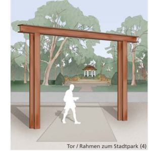
Tor / Rahmen zum Stadtpark (4)